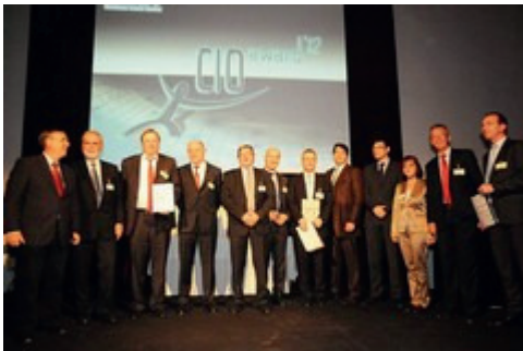
Die CIO AWARD Preisträger

Zum mittlerweile fünften Mal wurden auf dem Confare CIO & IT-Manager Summit am 26. April 2012 die besten IT-Manager des Jahres ausgezeichnet.