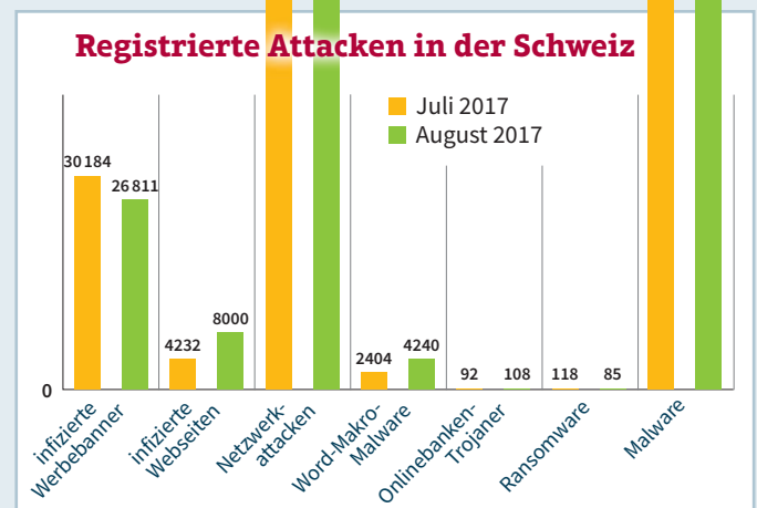
Statistische Erkennungen im Juni 2017 (quantitativ)

Registrierte Attacken in der Schweiz in Prozent der weltweit erkannten Attacken.